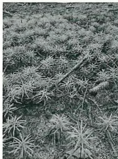
2-jährige Weiß-Tannen Saat im Stadtwald Bad Münsterfeld

Eine Mammutaufgabe auch für den Forstbetrieb der Stadt, bei dem seit 2018 nahezu alle Fichtenbestände vor der Auflösung stehen. Alternative Waldbau-Konzepte mit standortsangepasstem Pflanzgut sollen die labilen Fichtenbestände stabilisieren. Die Weiß-Tanne ist dabei eine Baumart mit guten Prognosen in klimatisch unsicheren Zeiten.