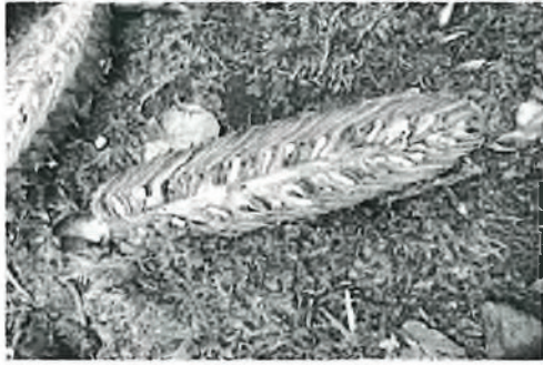
Schnittbild durch einen Weiß-Tannen Zapfen mit > 20 vollen Samenkörnern